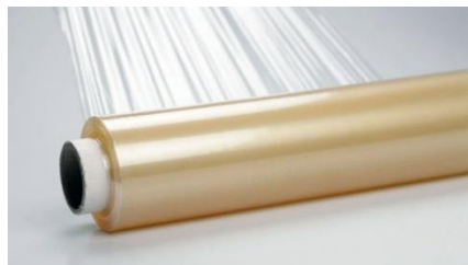
pellicola trasparente per alimenti